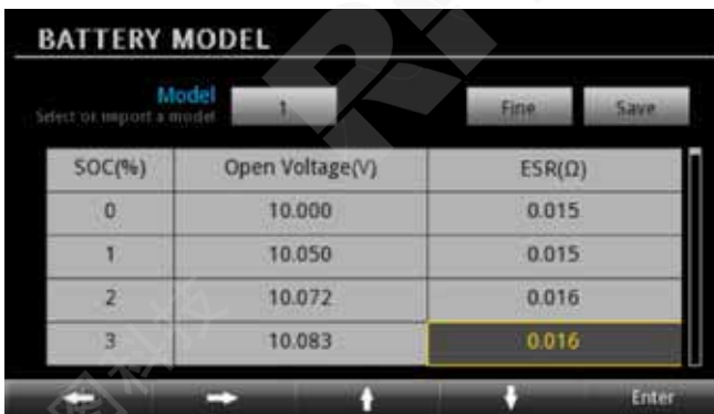
图 5. 电池模型。