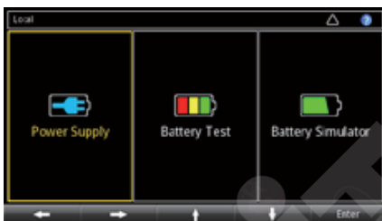
图 1. Series 2281S 启动屏幕。

2281S 采用线性调节，保证低输出噪声和杰出的负载电流测量灵敏度。采用高清彩色晶体管 (TFT) 屏幕显示与测量有关的各种信息。软键按钮和导航轮与 TFT 显示器相结合，提供了一个浏览方便的用户界面，加快仪器设置和操作。此外，内置绘图功能可以监测各种趋势，如漂移。这些功能提供了台式和自动测试应用要求的灵活性。此外，2281S 提供了列表模式、触发和其他速度优化功能，最大限度地减少自动测试应用中的测试时间。