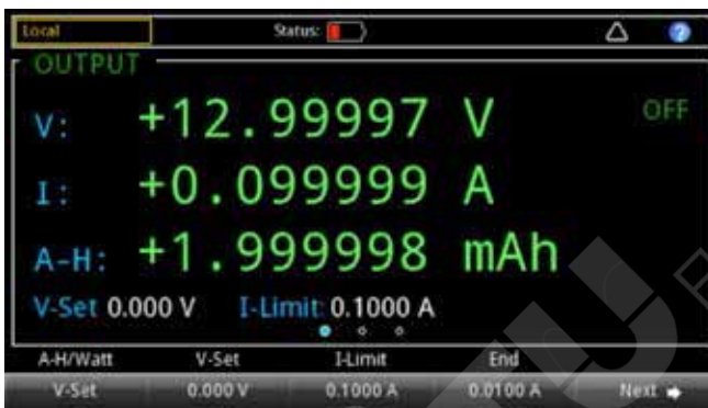
图 4. 电池测试显示。

在测试后，可以根据电池充电过程的测量结果生成电池模型。可以以 CSV 文件格式编辑、创建、导入或导出电池模型。