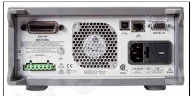
图 7. 2281S 后面板。

用户可以选择前面板端子或后面板端子，增强连接的灵活性。为实现最大电压精度，4 线远程传感保证编程的输出电压是应用到负载的实际电平。此外，它监测传感线路，检测其中的任何中断。这些功能保证了可以迅速识别和校正任何生产问题。可以通过内置 GPIB、USB 或 LAN 接口控制 Series 2281S 电源。USB 接口符合测试测量系统标准 (TMC)。符合 LXI 核心标准的 LAN 接口支持远程控制和监测 Series 2281S 电源，因此测试工程师可以一直接入电源，查看测量数据，即使电源和测试系统位于不同的两大洲。