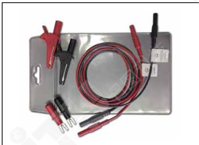
Model 2280-TEST-LEAD: 电源测试线套件, 1000V, 20A 额定值: 包含 122 厘米 (4 英尺) 电缆, 平接线片适配器, 鳄鱼夹。