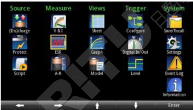
图 6. 电池测试菜单。

高亮度 4.3 英寸 TFT 显示器用大的易读字符显示电压、电流和安时读数、源设置及许多其他设置。基于图标的主菜单提供了用户可以控制和设置的所有功能，可以快速进入源设置、测量设置、显示格式、触发选项和系统设置。菜单简短，所有选项容易查找且描述清楚，可以使用导航轮、数字键盘或软键迅速设置测试参数。许多设置参数，如电压和电流设置，可以直接从主屏输入；不复杂的测试无需进入主菜单进行设置，就可以在主屏上使用软菜单进行调节。不管测试要求简单还是复杂，Series 2281S 电源都为设置所有要求的参数提供了一种简便方式。