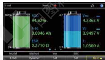
图 2. 电池仿真器主屏。